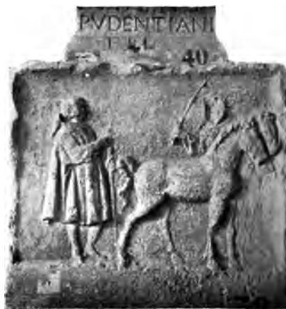
Stèle gallo-romaine (Musée archéologique).

Les dispositions de ces « basiliques » sont à peine connues. Grégoire de Tours rapporte qu'elles avaient un atrium, une abside, et que de saints personnages y reçurent leur sépulture, dans des sarcophages immenses, dont quelques-uns en marbre de Paros. En tout cas, elles ne durèrent pas longtemps, car en Bourgogne, comme dans le reste du pays, les années qui suivirent la mort de Charlemagne furent dures pour l'art religieux. Sans doute, Dijon, protégé par ses fortes murailles, résista, mieux que d'autres cités, aux attaques des Normands; l'on raconte même que, dans leur course folle à travers la France, les moines, emportant sur leurs épaules les corps sacrés confiés à leur garde, trouvèrent en cette ville l'asile « inexpugnable » qu'ils cherchaient pour déposer leurs précieux fardeaux. La décadence matérielle et morale du clergé.